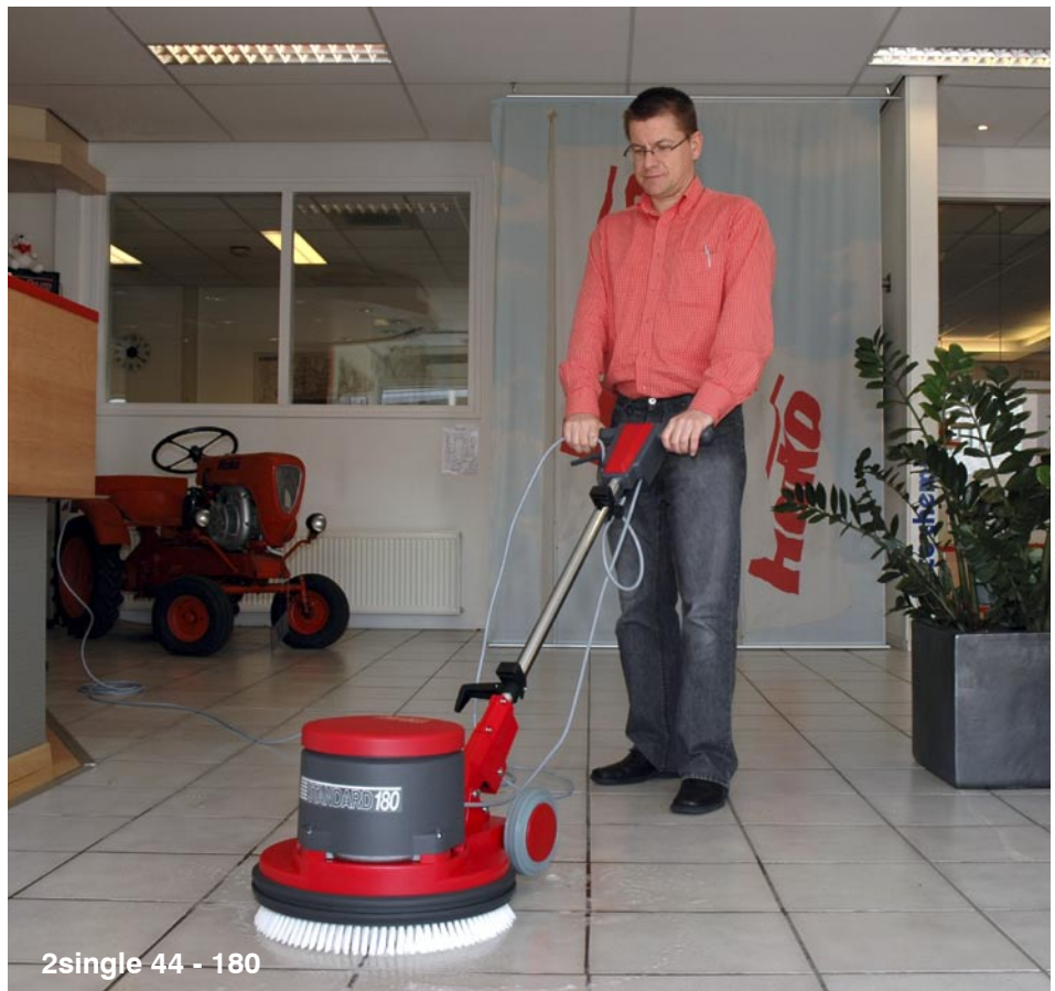
2single 44 - 180