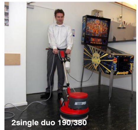
2single duo 190/380