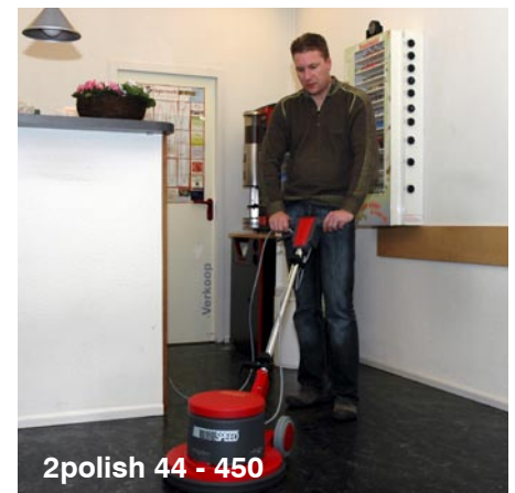
2polish 44 - 450