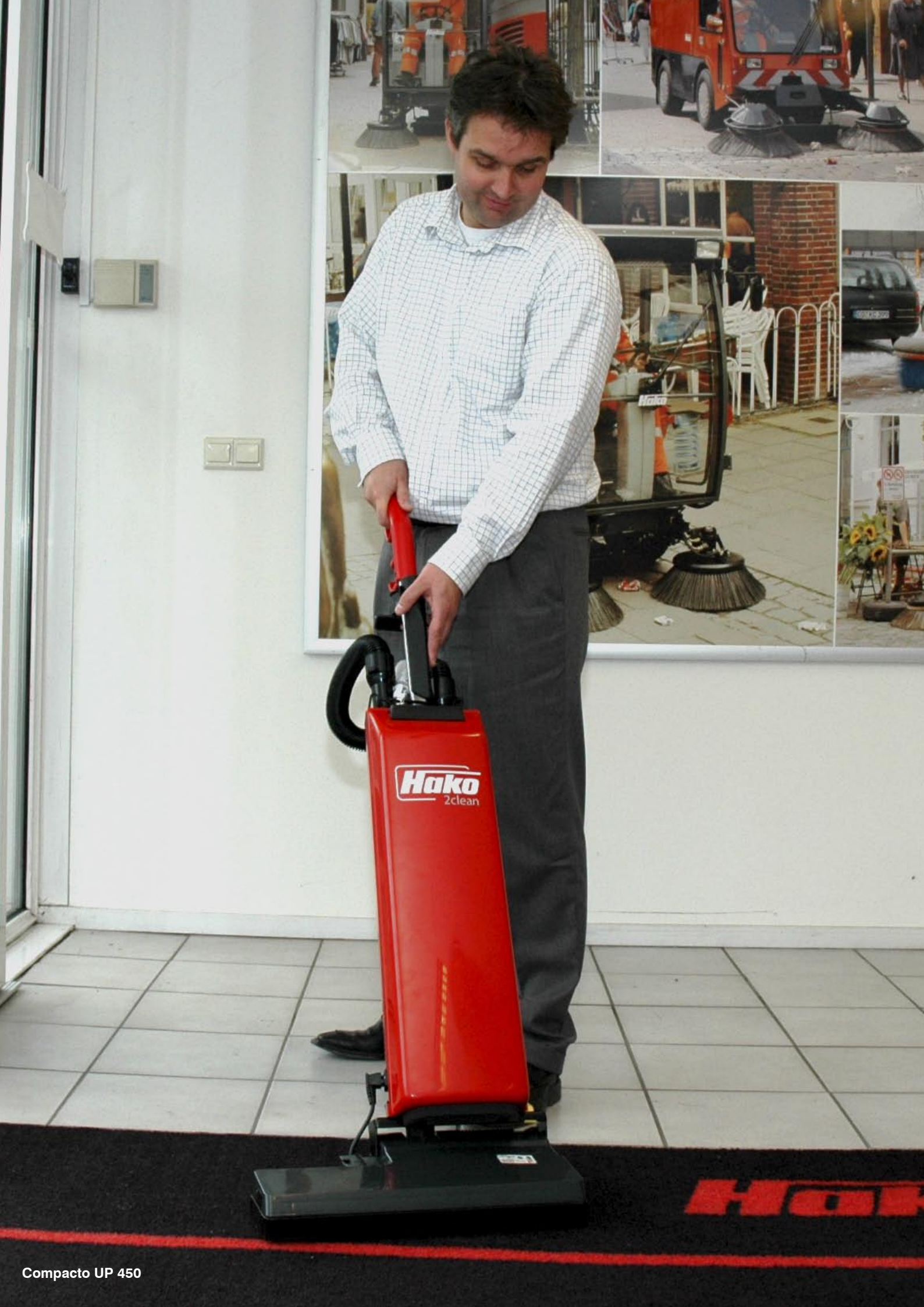
Compacto UP 450