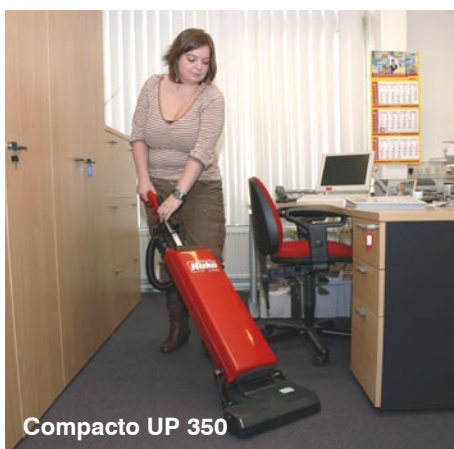
Compacto UP 350